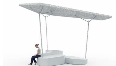
îlot frais banquise

Les deux îlots procurent une première sensation de fraîcheur grâce à leur toiture apportant de l'ombre. Amélioré cette année, le socle de